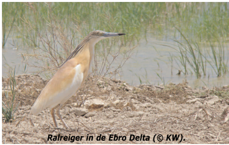
Ralreiger in de Ebro Delta.

steile rotswanden bij Riglos, Roldán en Vadiello (gieren!) en bezoeken het Romaanse kasteel van Loarre. Ook naar de rode wouwenlaapplaats (50 - 300) en naar de kraanvogelslaapplaats. Dag 8. Terugreis, retour vliegveld Barcelona