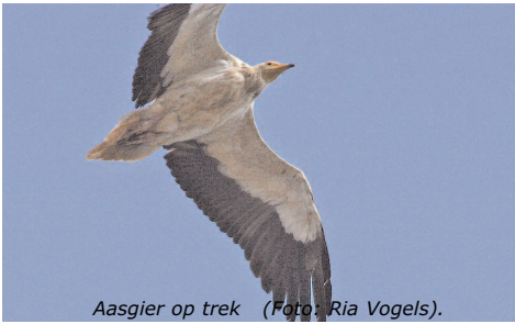
Aasgier op trek.

ZA. 11 T/M ZA. 18 SEPTEMBER 2010 VERWACHT AANTAL VOGELSOORTEN: 110-130. € 1095 (8 DAGEN O.L.V. KEES WOUTERSEN)