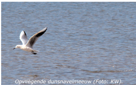
Opvliegende dunsnavelmeeuw (Foto: KW).