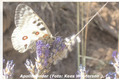
Apollovlinder (Foto: Kees Woutersen).