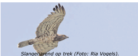
Slangenarend op trek.

een natuurgebied in de omgeving. We overnachten hier vlakbij het strand, zodat we vanaf het terras van ons restaurant over zee kunnen kijken. Dag 1. Aankomst, ophalen in Málaga Vervoer naar Tarifa, voor vijf overnachtingen. Dag 2, 3, 4, 5. We bekijken vogeltrek op de heuvels van Tarifa, zeetrek, het strand en het bos. Dag 6. Laguna de Medina, Donaña Via het meer Medina (knobbelmeerkoet, witkopeend?) gaan we naar El Rocio, Doñana, voor een nacht. We bezoeken plekken waar nog water staat en de riviertjes bij het dorp. Dag 7. Doñana, Brazo del Este In deze afgesloten rivierarm staat altijd water. Er zijn rijstvelden met grote groepen ooievaars en watervogels. Overnachting bij Antequera.