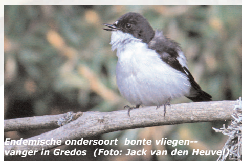
Endemische ondersoort bonte vliegenvanger in Gredos

We gaan naar de klassieke plekken van dit roofvogelrijke natuurpark, op zoek naar nesten van vale gier, monniksgier, aasgier, Spaanse keizerarend, zwarte ooievaar, raaf en oehoe. Stops langs