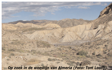
Op zoek in de woestijn van Almería.

In het woestijngebied vinden we hoge dichtheden van o.a. havikarend, griel, zwartbuikzandhoen, zuidelijke klapekster en zwarte tapuit. Waar vinden we zoveel witkopen, en reigers als in de wetlands aan de kust, vale pijlstormvogels en Audouins meeuwen op zee? In de woestijn leven kleine trap, kalander-, Tekla- en kortteenleeuwerik, hop, rots-