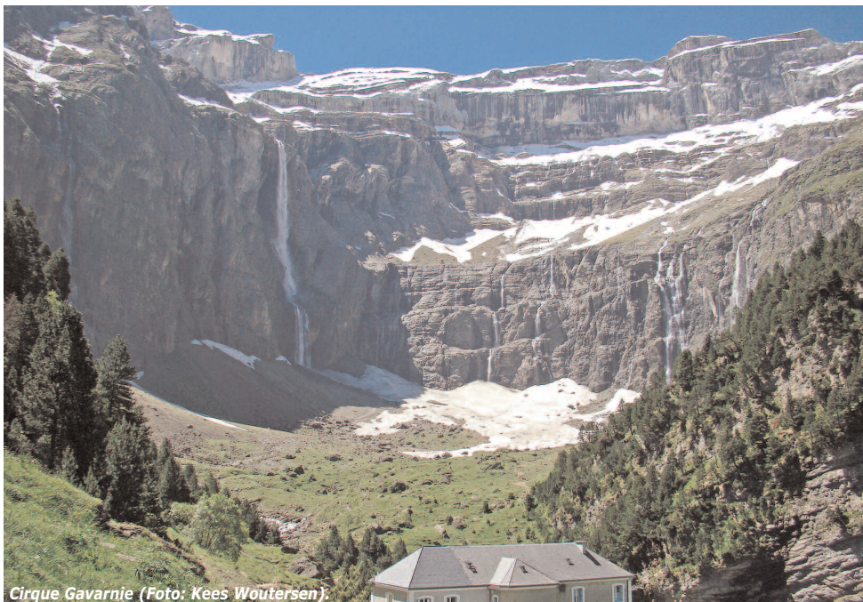
Cirque Gavarnie (Foto: Kees Woutersen).