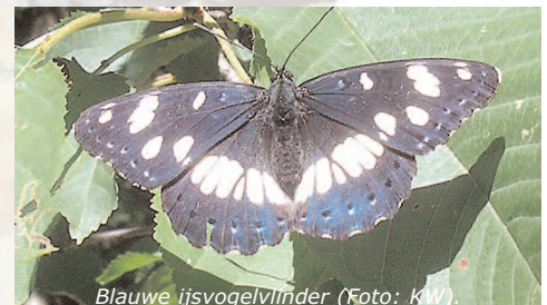
Blauwe ijsvogelvlinder.

Onder de opvallendste vlinders vinden we de apollo, de grootste dagvlinder van Europa. Hij zweeft van bloem tot bloem en is zelfs te fotograferen met een eenvoudige camera. Konings- en koningennepages zijn andere grote vlinders en er is kans op de grote weerschijnvlinder. Zilvervlek en andere parelmoervlinders, blauwtjes en dikkopjes zijn moeilijker te determineren. Veel vlinders zijn opvallend gekleurd zoals morgenrood, dagpauwoog en kleine vos. Bij de beekjes kunnen we groepjes "drinkende" vlinders zien, vooral blauwtjes. Het "Gavarnie blauwtje" ( Agriades pyrenaeicus ) is de specialiteit van dit gebied.