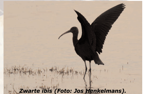
Zwarte ibis.

Het landschap in NO-Spanje is bijzonder gevarieerd. In de Ebro Delta broeden reigers in beschermde plassen en rietvelden terwijl ze voedsel zoeken in de rijstvelden: kleine - en grote zilvreiger, koereiger, blauwe - en purperreiger, ralreiger, kwak en woudaap. Aan de kust zijn unieke kolonies van Audouins- en dunsnavelmeeuw. We vinden er krooneend, flamingo, purperkoet, steltlopers en zes soorten sterns. In de verlaten steppen van Los Monegros broeden kleine trap, griel, blonde tapuit, wit- en zwartbuikzandhoen, brilgrasmus en veel leeuwerikken. In de Pyreneeën vinden we hoge toppen, kale rotsformaties, diepe kloven, rivieren en bossen. We gaan op zoek naar gierenkolonies, roofvogels (lammergier!) en Z-Europese vogels, als hop, bijeneter en rode rotslijster.