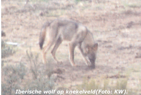
Iberische wolf op knekelveld.

Wolven leven verborgen op woeste gronden, in sierras en uitgestrekte graanvelden. De grootste dichtheden van Europa vinden we in NW-Spanje. Het voedsel is zeer edelherten, reeën, wilde zwijnen, hazen en konijnen. Om de kans klein te houden dat ze levend vee pakken worden regelmatig kadavers uitge-