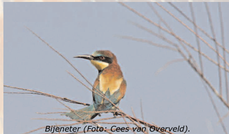
Bijeneter (Foto: Cees van Overveld).

Het binnenland van Mallorca ziet er pitoresk uit: olijfgaarden, fruitbomen, wijnbouw en graanteelt. Daartussen liggen dorpjes die door kleine wegen verbonden zijn. In het zuiden liggen de stranden, met de groter toeristencomplexen. In het oosten en noorden is veel minder toerisme, worden de stranden afgewisseld met rotskusten en schiereilanden en in het westen ligt het grote berggebied Tramuntano.