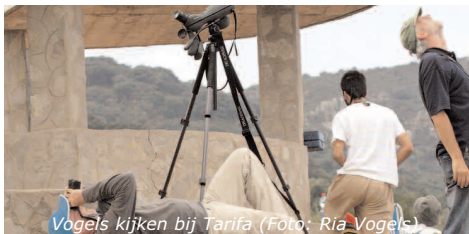
Vogels kijken bij Tarifa

De grote moerassen van Doñana zijn nu bijna opgedroogd. We vinden concentraties watervogels en steltlopers op plekken waar nog water staat. Bij Tarifa, het zuidelijkste punt van Europa, concentreert zich de vogeltrek. Vanaf de heuvels bij het stadje zijn vooral de duizenden roofvogels en ooievaars spectaculair. Het is toptijd voor o.a. zwarte ooievaar, aasgier, dwerg- en slangenarend. Langs de kust trekken Kuhls pijlstormvogel, (Bengaalse) sterns en Audouins meeuw. Naast trekvogels zoeken we grote groepen koereigers en ooievaars, steltlopers, sterns, en roofvogels. Bij Tarifa besteden we ongeveer de helft van de tijd aan het observeren van vogeltrek, in de middag gaan we naar