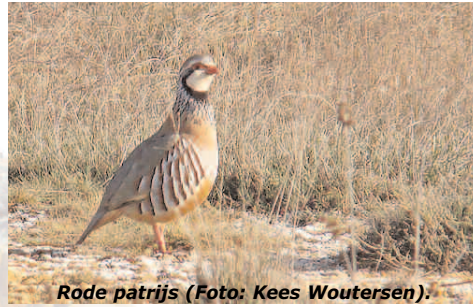
Rode patrijs.

Dag 1. Aankomst, ophalen in Madrid Vervoer naar ons hotel bij Zamora, 4 nachten. Dag 2 t/m 5. Wolfenexcursies