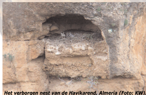
Het verborgen nest van de Havikarend, Almería.

Dag 1. Aankomst, ophalen in Málaga Vervoer naar Tabernas voor vijf nachten. We pauzeren bij een plas met witkopen. Hier ligt ook het bizarre kassenlandschap. Dag 2. Salinas viejas del Sabinar We bezoeken de in onbruik geraakte zoutpannen van Sabinar: riet, brak water en duinen. Dag 3. Tabernas, Sierra Almohadilla We bezoeken het berglandschap met rotskloven en droge rivierbeddingen. Via een kleine weg komen we bij de top met uitzicht van de Middellandse zee tot de Sierra Nevada. Dag 4. Gabo de Gata Dit natuurpark is groot, gevarieerd en indrukwekkend. Rotsen steken ver in zee, er groeit steppevegetatie, er zijn velden agaves en de grote zoutpannen zijn in gebruik.