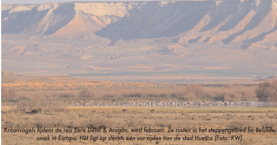
Kraanvogels tijdens de reis Ebro Delta & Aragón, eind februari. Ze rusten in het steppengebied bij Belchite, uniek in Europa. Het ligt op slechts één uur rijden van de stad Huesca.

Roofvogels kijken vanaf het terras? ARAGON Natuurreizen Spanje heeft twee authentieke, gemoderniseerde huizen in eigendom aan de voet van de Pyreneeën in Spanje. Hier kunt u wandelen of vogelen en vanaf het terras van de natuur genieten. Als huurder krijgt u gedetailleerde excursie-informatie.