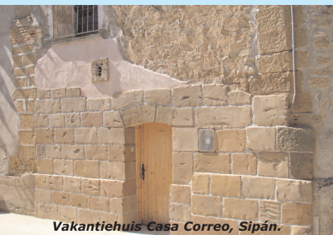
Vakantiehuis Casa Correo, Sipán.